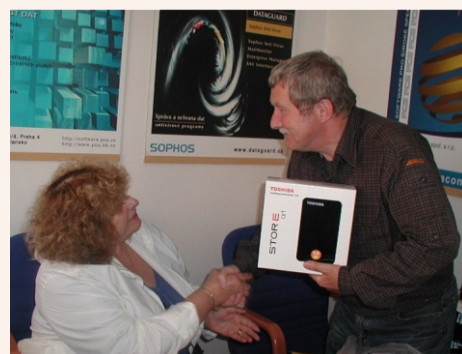
Předání 3. ceny - paní Jaroslavě z Prahy